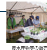
農水産物等の販売

※展示・イベントは予定です。他にも展示・イベント多数。詳細はホームページをご覧ください。 ※やむを得ず内容等を変更する場合は、ホームページ・LINE公式アカウントにてお知らせします。