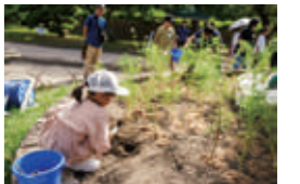
キッズガーデニング体験