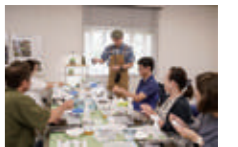
コケ展 in 明石